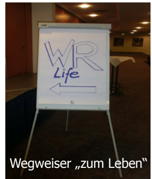
Wegweiser „zum Leben“